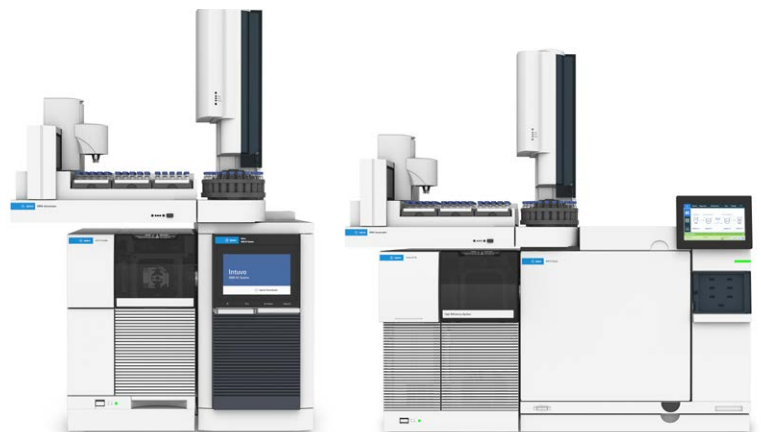
Agilent Intuvo 9000 GC 시스템

지속적인 헬륨 부족은 GC 분석가들에게 예측 불가능성을 야기할 수 있습니다. 다행스럽게도 헬륨 가격 변동과 공급 중단을 관리하고 가스를 덜 사용할 수 있는 방법도 있습니다.